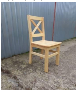
Zdjęcia poglądowe: krzesło drewniane