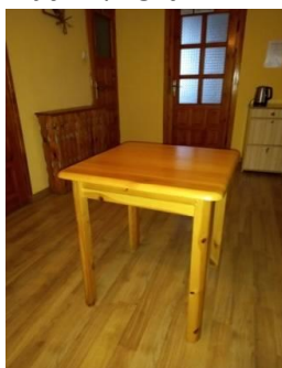
Zdjęcia poglądowe: stół drewniany