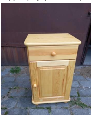
Zdjęcia poglądowe: szafka przytóżkowa

Drzwi z zawiasami puszkowymi umożliwiającymi otwieranie pod kątem 90°. Nogi szafki drewniane kuliste w o wysokości 50 mm i średnicy 50 mm, uchwyty w formie gałek drewnianych.